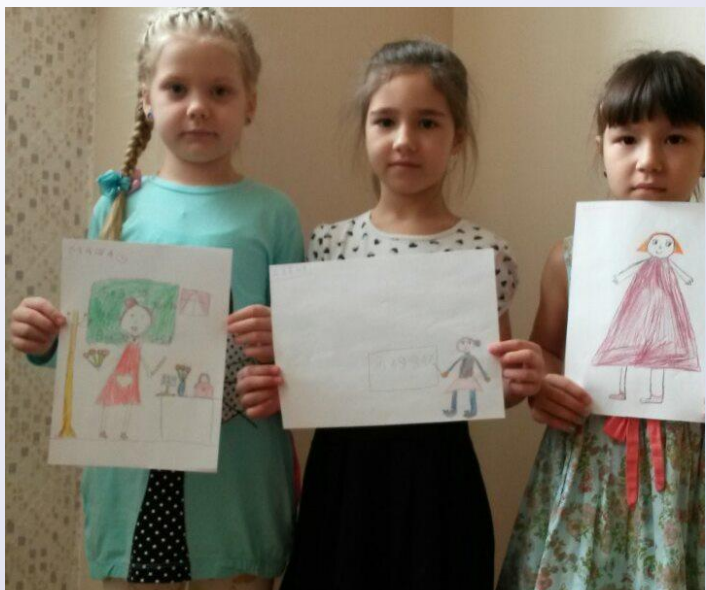
Мероприятия в ДОУ рисунки «Мой будущий учитель», «Я в школе», «Кто где?»