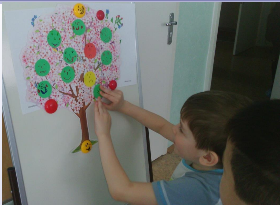
Мероприятия в ДОУ занятие «Создание дерева «С каким настроением я пойду в школу»