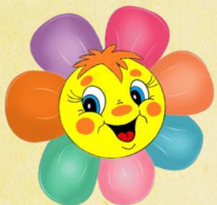
ГРАФИК ВСЕРОССИЙСКИХ КОНКУРСОВ И ОЛИМПИАД ДЛЯ ДЕТЕЙ РРДЦ "РАДУГА" ИЮНЬ 2023 ГОД