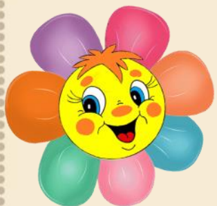
ГРАФИК ВСЕРОССИЙСКИХ КОНКУРСОВ И ОЛИМПИАД ДЛЯ ДЕТЕЙ РРДЦ "РАДУГА" МАЙ 2023 год