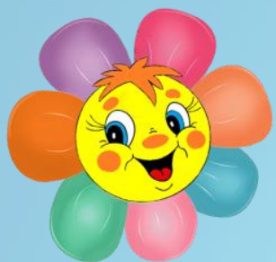
ГРАФИК ВСЕРОССИЙСКИХ КОНКУРСОВ И ОЛИМПИАД ДЛЯ ДЕТЕЙ РРДЦ "РАДУГА" МАРТ 2023 год