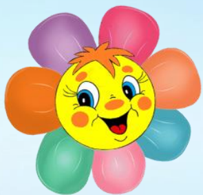
ГРАФИК ВСЕРОССИЙСКИХ КОНКУРСОВ И ОЛИМПИАД ДЛЯ ДЕТЕЙ РРДЦ "РАДУГА" АПРЕЛЬ 2023 ГОД