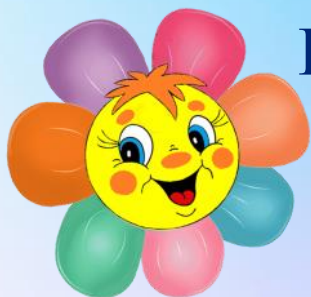
ГРАФИК ВСЕРОССИЙСКИХ КОНКУРСОВ И ОЛИМПИАД ДЛЯ ДЕТЕЙ РРДЦ "РАДУГА" ФЕВРАЛЬ 2023 год